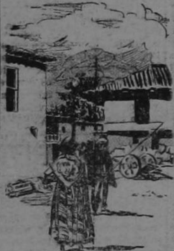
By Temple Manning

At Guayaquil, the chief port, is about 30 miles up on the Guayas river. It is a fascinating trip to reach it. The river banks are lined with the still, thatched native huts and fringed with jungle. The waterfront is a busy one, a nice introduction to busy Guayaquil. The Malecón, a boulevard that lines the waterfront, is impressive. Off it are nat-