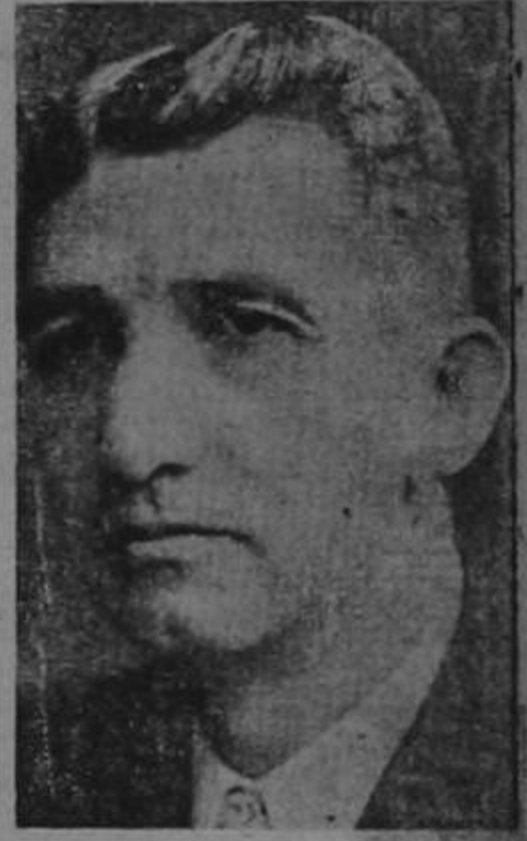
Lic. don León Cortés